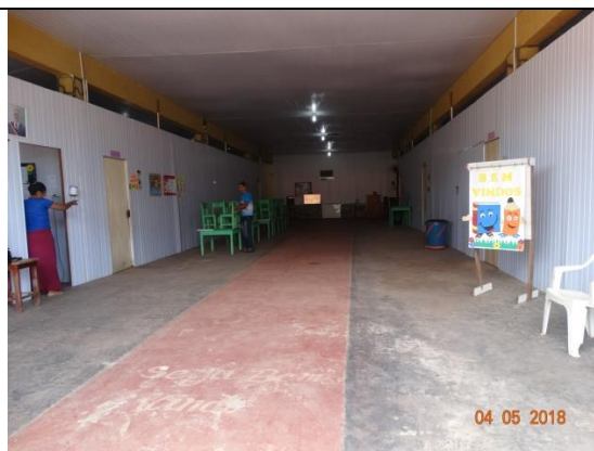
SALA DE PROFESSORES